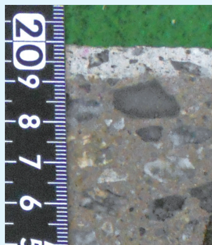
▲含浸深さイメージ